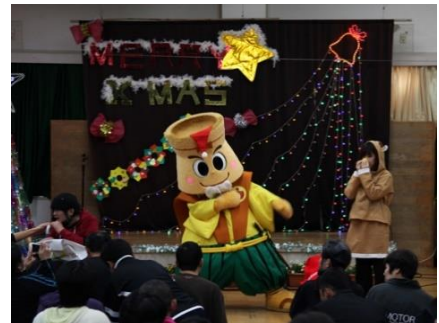
〔 クリスマス会 〕