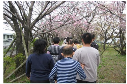
〔 バスハイク 〕

バスハイクや買い物外出、誕生者外出に出掛け気分転換を図り、充実した毎日が送れるよう支援しています。