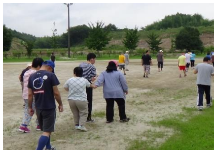
〔 ウォーキング 〕