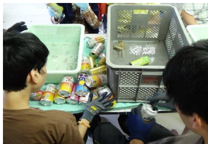
〔 リサイクル作業 〕