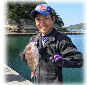
レクリエーションで魚釣り♪

仕事にも人生にもメリハリを！ 一生懸命働いて、 一生懸命遊びましょう！ 一生付き合える仲間を作って、 自分の意思と自分の責任で、 人生前向きに楽しんでいこう！