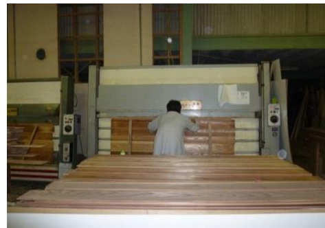
〔 木材の圧着工程の様子 〕

木材の板を圧着機にてプレスする木材加工を行っています。木工加工の補助業務や、木工所内の清掃作業を主に行っています。専門の職人の補助業務になりますので、ものづくりの面白さを間近で体験出来ます。働くことの楽しさ、仕事に対してのやりがいを持つことで社会参加につなげていきます。その他、農作物の選別作業や部品製作など多数ありますので、利用者ご本人に合ったお仕事をご紹介します。