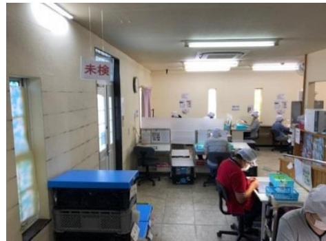
〔 自動車部品検査の様子 〕

自動車部品(プラスチック製品)の外観検査を行っています。製品の外観をチェックして、変色や傷などの不具合がないかを見つける作業です。決められた時間の中でより多くの量をこなすにはどうしたらいいのかを考えながら作業すると、大きなやりがいを見いだせます。その他、封入作業やシャツの生地見本製作などを行っています。