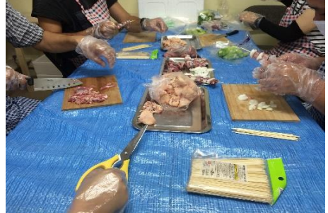
焼き鳥の串刺作業の様子