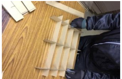
段ボール組立作業風景