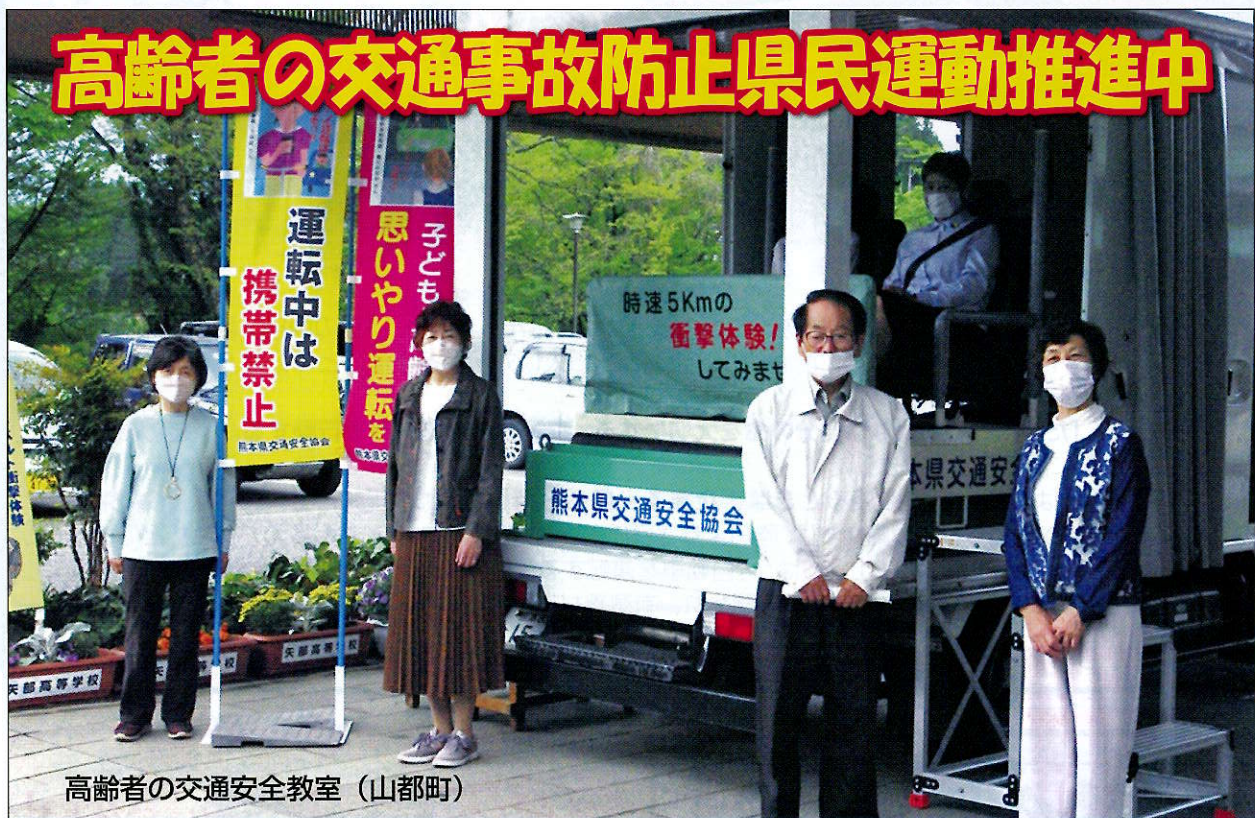
高齢者の交通安全教室 (山都町)

令和3年中の交通事故による死者数は39人と、昭和23年以降最少を達成していますが、65歳以上の高齢者の死者数は22人(全体の約6割)と高い割合を示しています。