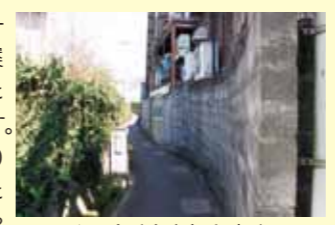
▲みちくさ小径を歩く

玉東フットパスコース、4つめのコース案内は「木葉の町並みと三池往還コース」です。木葉地区は、1300年前につくられたという木葉猿の伝承や奈良時代に勧請された木葉宇都宮神社、稲佐熊野座神社に見るよう古来より人や物の往来の盛んなところでした。人々の行き交う道は、江戸時代には「三池往還」と呼ばれ、道沿いには商店が並び賑わいをみせました。また、明治10年西南戦争時には政府軍の本営が設置され軍隊の町と化したこともありました。