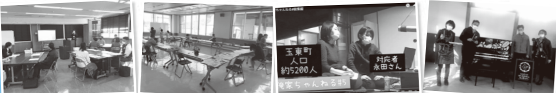
▲移住定住加速事業研修 ▲お絵描き教室。みんな集中しています ▲パソコンを使ってオンライン移住相談会 ▲NHK取材時のひとコマ