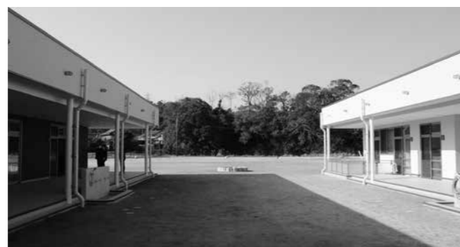
新しい園舎の様子