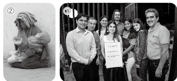
①大学院の修士課程を首席で終えた女性のパーティに招待された時の写真(コロンビア) ②家がなく通りの歩道で物乞いする親子(グアテマラ) ③靴磨きの子(グアテマラ)

途上国と呼ばれる国々では、「安心して飲める水がない」「子どもが勉強をさせてもらえない」など多くの問題があります。みんなが安心して生活を送れるように、今私たちにできることは何か、まずは考えることから始めませんか。