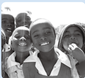
町を見つめ、これまで役職員でさえも気づけなかった課題を発見し、解決に向け積極的な活動を行ってくれました。JICA訓練生と多くの人々が関わりを持ったこの4カ月間を通して、改めて出会うの素晴らしさを知りました。コロナ禍の影響で暗いニュースに囲まれる中、町に光を灯してくれた、そんな存在であつたと思います。

基本目標は、「開発途上国の経済・社会の発展、復興への寄与」「異文化社会における相互理解の深化と共生」「ボランティア経験の社会還元」となっていて、基本目標のほか日本国内への貢献も求められており、今回は縁あって新型コロナウイルス感染症拡大の影響で海外派遣が延期になった4人の隊員と1人のコーディネーターを特別派遣前訓練として玉東町に迎え入れ、地域の課題解決にあたっていただきました。 4人のボランティア隊員は個々の能力を生かし、それぞれ違った分野で活動しましたが、年齢もこれまでの経験も全く違う4人の隊員が、知らない土地での短期間をどのように活動するのか興味深い4カ月間でした。海外の任地とは違った日本ならではの難しさもあつたはずですが、彼らのそれぞれのノウハウを生かし「よそ者」の視点で