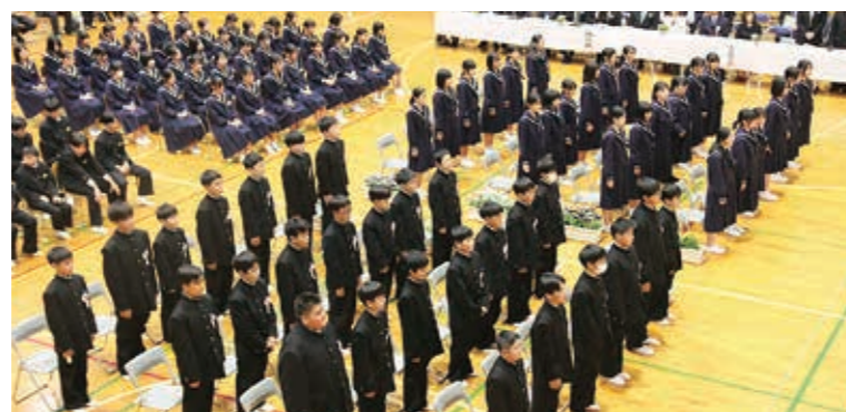
▲ 玉東中入学式の様子