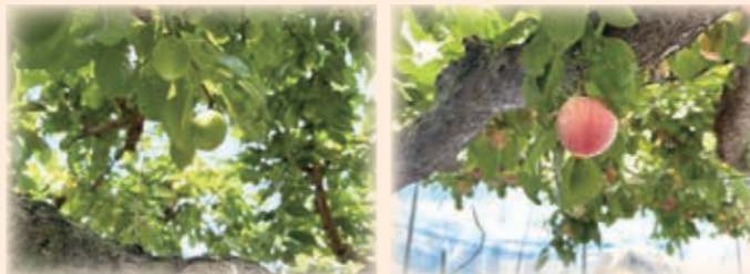
▲今年5月上旬の様子

これまでに生産者、JA、県の努力による生産技術の向上、町や我が社による加工品開発によるPR、町民の皆様の応援など、関係者みんなで守り育ててきた結果、超人気の果物となりました。