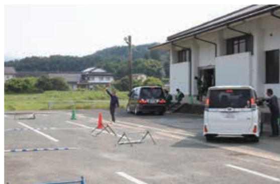
▲ 玉東中引き渡しの様子

有事の際は更なる混乱が予想されるので皆で力を合わせ安全の確保に努めたい」と述べられました。