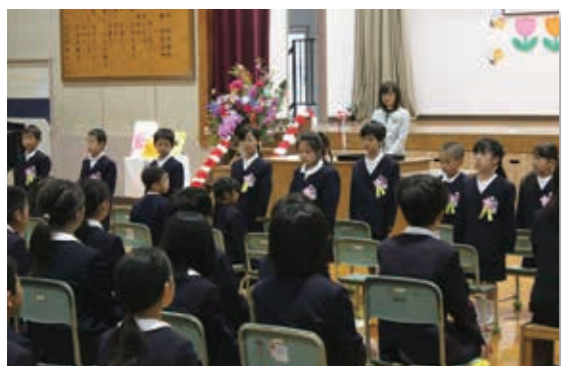
▲ 木葉小学校入学式の様子

玉東中入学式では、新入生代表が「先輩達のご指導を仰ぎながら、仲間と共に切磋琢磨し、成長していきたい」と、力強く決意を述べました。