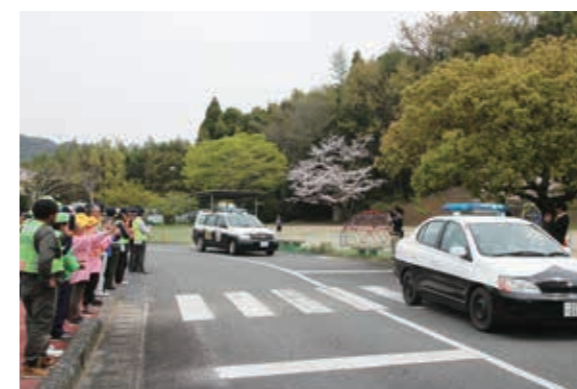
▲ 街頭パトロールに出発する様子