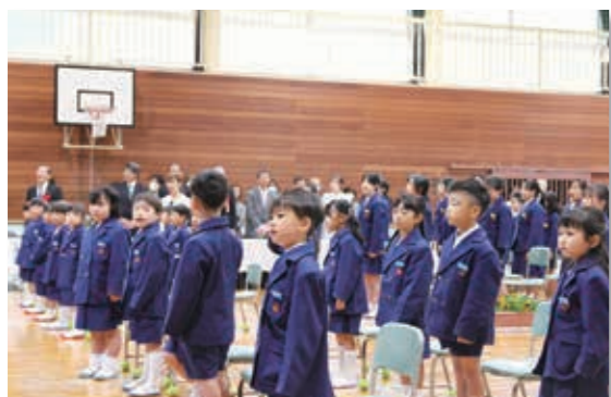
▲ 山北小学校入学式の様子