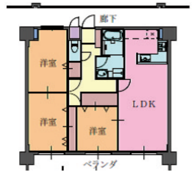
Cタイプ 3LDK 80.03㎡

次回の議会開催は6月中旬です。 ぜひ傍聴にきてください。 議会、広報紙に対するご意見・ご要望、請願・ 陳情等、また、議会広報紙への写真・記事等もお 寄せください、お待ちしております。