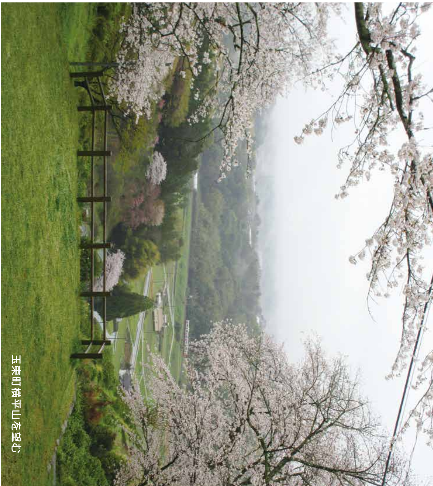
玉東町横平山を望む