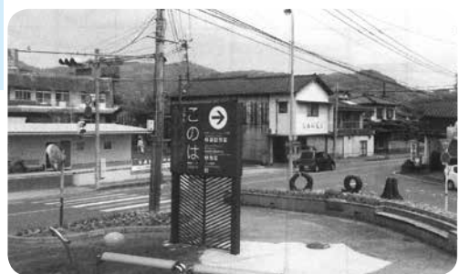
国道 土生野地区 交差点

(4) についてです。国道の土生野地区の交差点は国道、県道、町道が交わり極めて見通しの悪い形状の交差点となっており、一体となった交差点改良が実施出来るよう、国、県と協議を進めてまいります。将来的には国道から山北口踏切迄の県道改良を目指す。