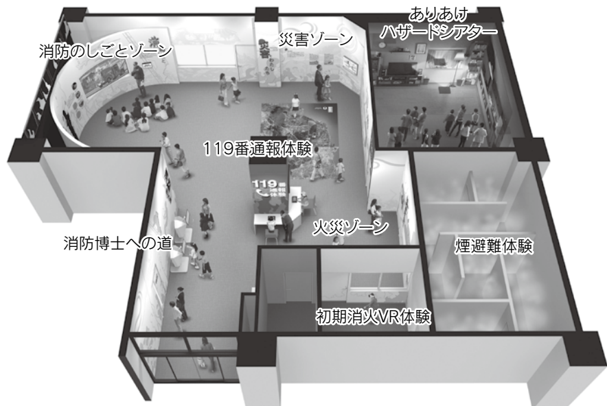
ありあけ防災館 配置図

地域住民の皆様や事業所等の職員の方々の防災に関する知識と災害への対応能力を高める目的として、庁舎1階に「ありあけ防災館（防災学習センター）」を設置いたしました。 ありあけ防災館の運用開始につきましては5月中旬頃を予定しております。