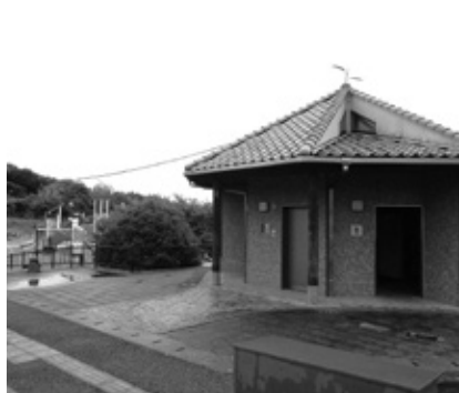
ふれあい広場トイレ

問 視きがあった場合は、声をバーンと出せば一面に聞こえます。壁はしたほうが良いということはないんじゃないかと。空気も変わっていくし、声を出した時に全体に聞こえますから犯罪抑止には十分になっていくんじゃないか。