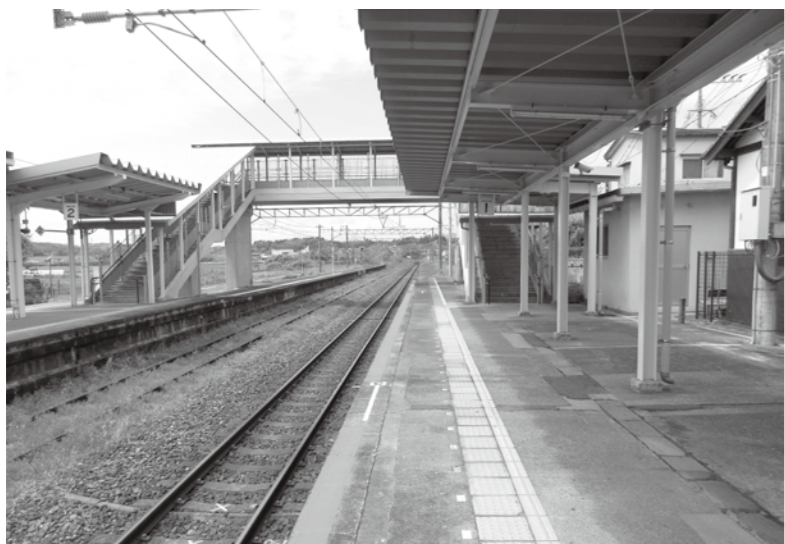
エレベーター設置が予定されている駅歩道橋

坂村議員 衛生使用料の中の交流センター使用料で減額、まん延防止法で休館が入館料の減となっている。3回目の接種も進んでいる中、運