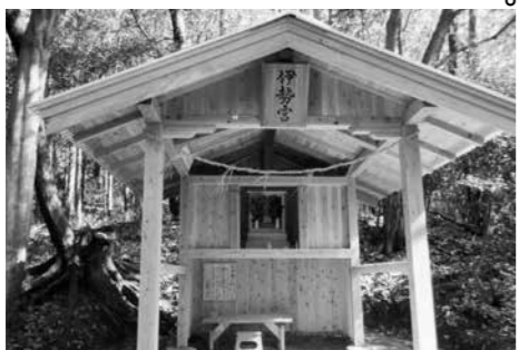
再建された伊勢宮

問 再建された伊勢宮は木葉小学校の北側の森の中に再建されています。天明6年、江戸時代の中で最も深刻な被害がでた「天明の大飢饉」の影響で、疫病が流行し、全国で90万人の死者がでて、その疫病の影響がこの地域にもおよんでいたため、山口区の元区長さんの先祖が、疫病退散と地域や家族の無病息災、家内安全・五穀豊穡を願って祭ったとされています。 答 町道から参拝道入口に案内板、傾斜部分に手すりの整備を町からの支援。 問 再建された伊勢宮は木葉小学校の北側の森の中に再建されています。天明6年、江戸時代の中で最も深刻な被害がでた「天明の大飢饉」の影響で、疫病が流行し、全国で90万人の死者がでて、その疫病の影響がこの地域にもおよんでいたため、山口区の元区長さんの先祖が、疫病退散と地域や家族の無病息災、家内安全・五穀豊穡を願って祭ったとされています。 答 再建されたことは把握していません。行政が神社仏閣に対して関与は日本国憲法第20条、第89条において禁止されており町としては関与できないので、関係者や地域で対応していくのが原則ではないかと思えます。 問 和木町の八つの神様は町が案内板を整備し支援してる。 答 総務課長 和木町の確認は取れておりませんが、地元の地域おこしとしていたいです。 まとめ 今後私達は感染症と共存しながら生活していかないと理学研究も者も言われ、自分自身がマスクや三密をより強く心掛け、心のよりどころに神頼みもしながら一日でも早く平穏な日常に戻りたい。