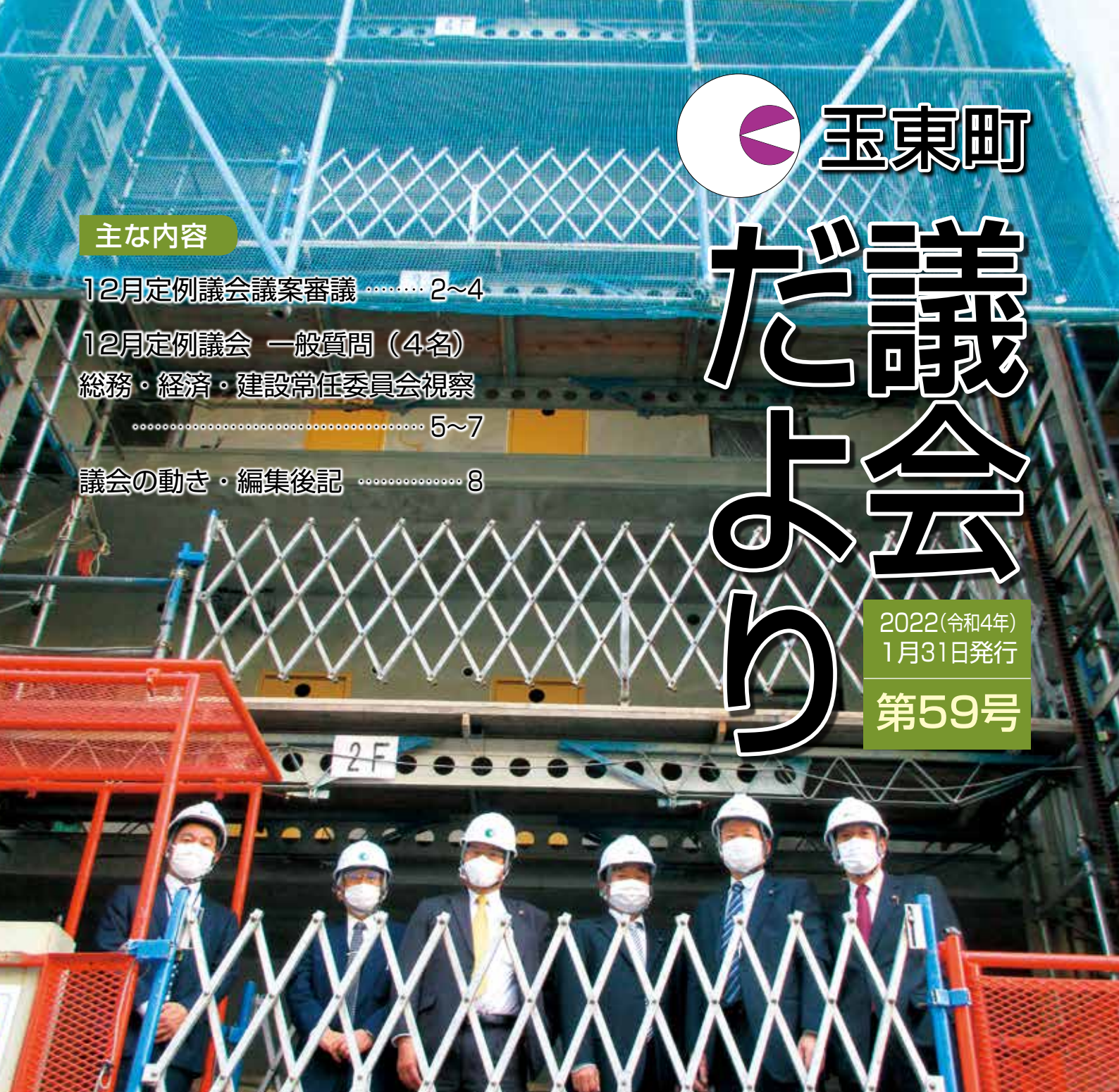
建設が進むアベニール木葉 (7ページに関連掲載)