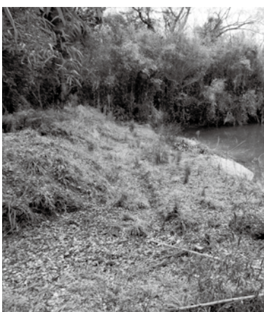
積み上げたままの土砂

問 山口区の黒石住宅入口で、坂門田踏切近くにあたる道路南側の崖が長さ25m、高さ5m位の垂直の状態です。土砂が崩れしており、通行者が危険で、小学生は通学路でもあり、また、稲佐区の中学生は自転車通学しており、緊急な対策を。 答 建設課長 民地で傾斜のきつい法面が切り立っている状況は確認しております。管理者の地権者には、危険を防止するため必要な措置を講じなければならぬため、まずは危険を回避できるような地権者に対応を行い、協議した上で対策を講じたいと考えております。