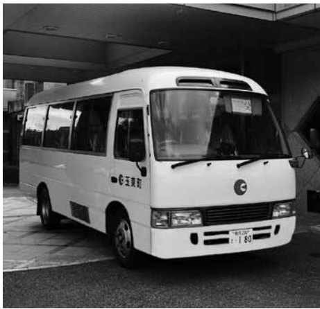
新しい福祉バス(イメージ)

バスは増車です。駅前施設を地区サロンに活用したい。駅前で月1回ぐらいできるなら。福祉バスだから、買物に行ったり病院、郵便局、銀行、役場などいろんなところに新しく建つ玉名の病院や植木の町立病院までは路線を延長していきたい。