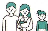
子ども2人のご家族 かつ

【フラット35】地域連携型(子育て支援)等との組み合わせご利用例(令和6年2月13日以降 新制度適用分)