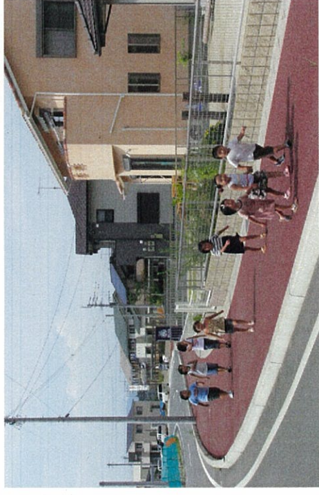
オレンジタウンの街並み

— 第4期分譲事業募集日程 — * 一般受付申込期間 平成20年5月1日(木) から 5月6日(火) まで (注意) 現地にて受付 * 公開抽選会 平成20年5月10日(土) 午前中 * 先着順受付 平成20年5月12日(月) から (注意) 役場：建設課にて受付